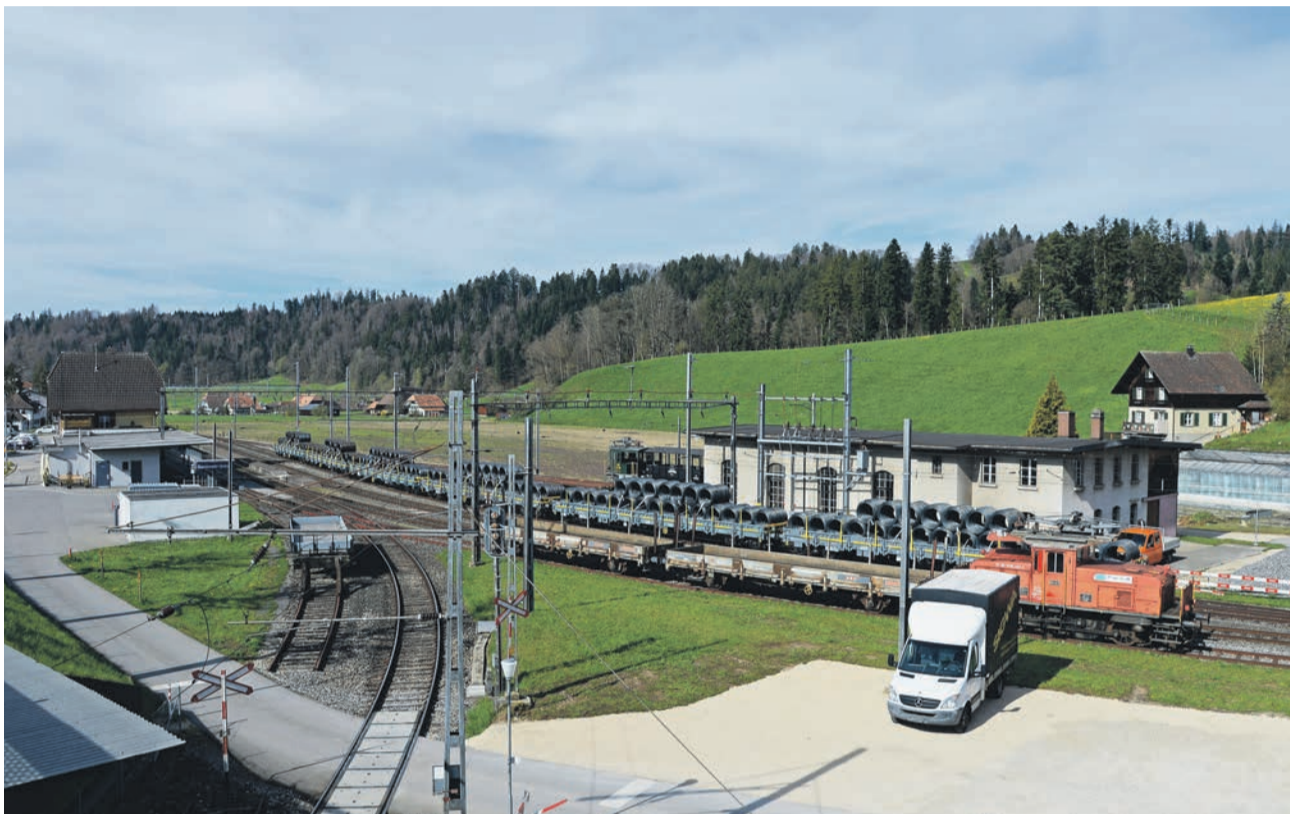
Güterumschlag am Bahnhof Sumiswald-Grünen.

Alle Angebote zu Stellen, Liegenschaften, Veranstaltungen, Empfehlungen usw.