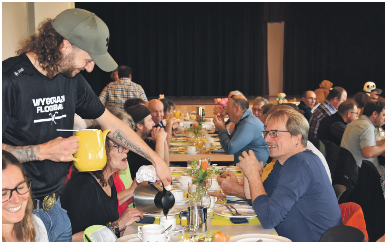
Turner/innen-Zmorge, organisiert vom Sportverein Wyssachen.