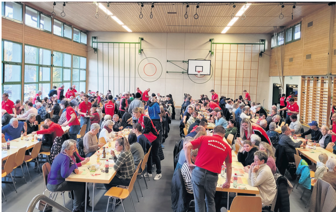
Am Wochenende fand in Dürrenroth das Lotto der Hornusser statt.

Bahnhofstrasse 9, 4950 Huttwil Telefon 062 959 80 75 anzeiger@schuerch-druck.ch