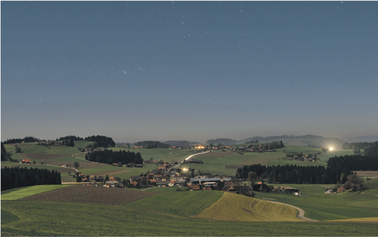
Affoltern und Weier fast ohne Licht, aufgenommen am 14. November um 22.30 Uhr.

EINWOHNERGEMEINDE AFFOLTERN I.E. Der Gemeinderat